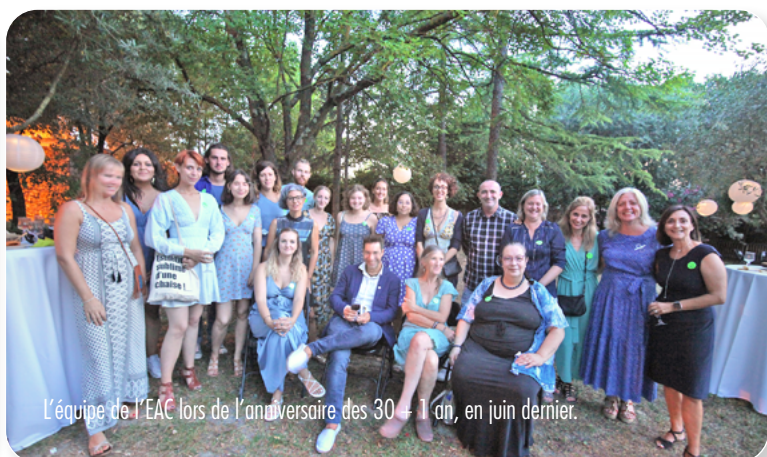
L'équipe de l'EAC lors de l'anniversaire des 30 + 1 an, en juin dernier.

Reporté pour cause de pandémie en 2020, le 30 e anniversaire de l'Espace de l'Art Concret a été célébré au début du mois de juillet dernier sous le titre « 30 + 1 an ! ».