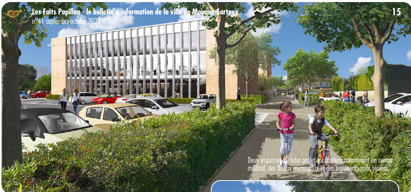
Deux esquisses du futur projet qui abritera notamment un centre médical, des locaux municipaux et des logements pour séniors.