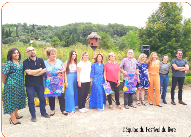
L'équipe du Festival du livre