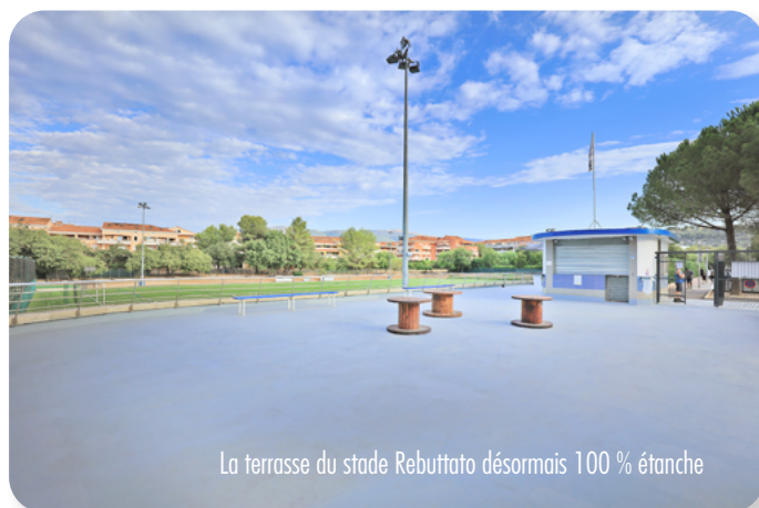
La terrasse du stade Rebuttato désormais 100 % étanche

Montant des travaux : 75 000 € (sur les fonds propres de la commune).