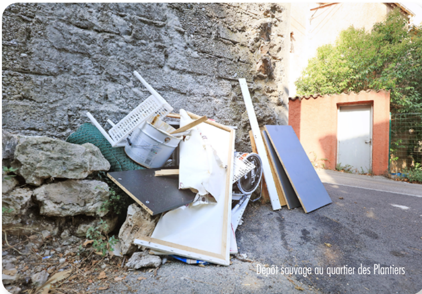
Dépôt sauvage au quartier des Plantiers

La commune constate une recrudescence des dépôts sauvages d'ordures, au quartier des Plantiers, à Grand Jardin et aux abords de la forêt communale. Dans certains lieux, des appareils photos ont été installés pour identifier les auteurs de ces dépôts.