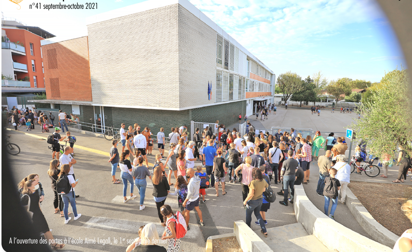
A l'ouverture des portes à l'école Aimé Legall, le 1 er septembre dernier