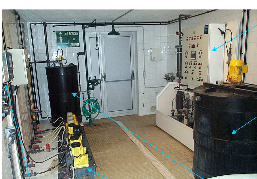
Générateur de bioxyde de chlore

Le chlore est fabriqué par électrolyse avec du sel de mer (chlorure de sodium utilisé en cuisine) dissous dans de l'eau.