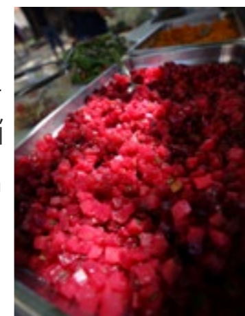
Salade de betteraves rouges cultivées à Haute Combe

Ecocert est un organisme spécialiste de la certification et du contrôle des produits issus de l'agriculture biologique. En 2013, l'entreprise a créé le label « En cuisine » pour la restauration collective, en partenariat avec Un Plus Bio, afin d'encourager l'introduction de produits bio et locaux dans les menus des cantines. Depuis 2014, les trois cantines de Mouans-Sartoux se plient donc au premier cahier des charges français de la restauration collective bio.