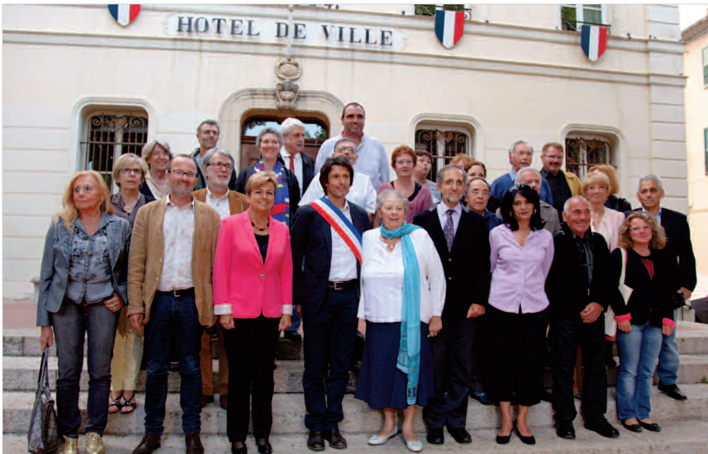
Le nouveau conseil municipal réuni le 21 mai 2015

d'une collectivité. Tout en réduisant les coûts de fonctionnement, il nous faut trouver de nouvelles sources de financement, valoriser le savoir faire et l'expertise des services municipaux, mieux valoriser le patrimoine et établir de nouvelles formes de partenariats d'investissement.