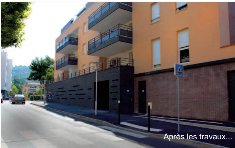
Après les travaux...

De la conception à la mise en service, l'ensemble des travaux ont été réalisés par les techniciens de la Régie Municipale des Eaux de la commune de Mouans-Sartoux à l'exception du terrassement qui, pour réduire au maximum la gêne pour les automobilistes, fut confié à l'entreprise PERROTINO, mieux équipée pour les circonstances. Cette substitution de canalisation a ainsi pu être réalisée en 7 jours ouvrés avec un arrêt d'eau de 2 h 30 et un de 5 h 00 pour les riverains de l'avenue Marcel Journet (que nous remercions encore pour leur compréhension et leur collaboration). Le montant de la dépense a été ainsi réduit à 17 000 €, auxquels il convient d'ajouter 3 300 € de main d'œuvre de la Régie Municipale des Eaux.