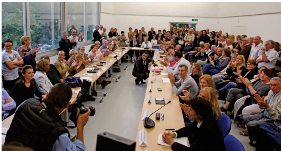
Lors de la séance publique du conseil municipal du 21 mai 2015

le dialogue direct. D'ailleurs, j'invite tous les Mouansois à participer à la prochaine rencontre publique où cours de laquelle nous présenterons tout cela et en débattrons. Ce sera le jeudi 2 juillet prochain.