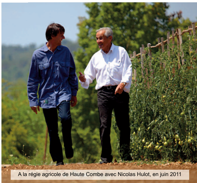
A la régie agricole de Haute Combe avec Nicolas Hulot, en juin 2011

« Monsieur le Maire, cher André. Petit village rural, Mouans-Sartoux aurait pu devenir la banlieue de Cannes et de Grasse.