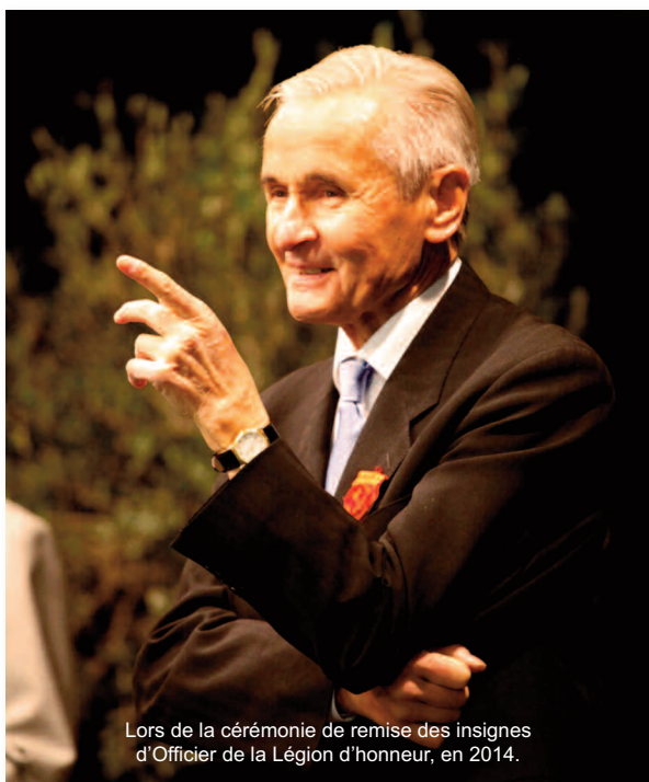
Lors de la cérémonie de remise des insignes d'Officier de la Légion d'honneur, en 2014.