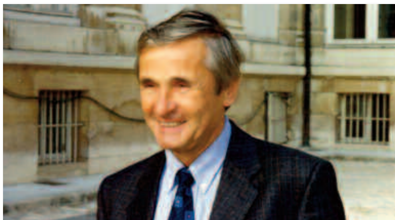
Député, André ASCHIERI a siégé à l'Assemblée nationale de 1997 à 2002.