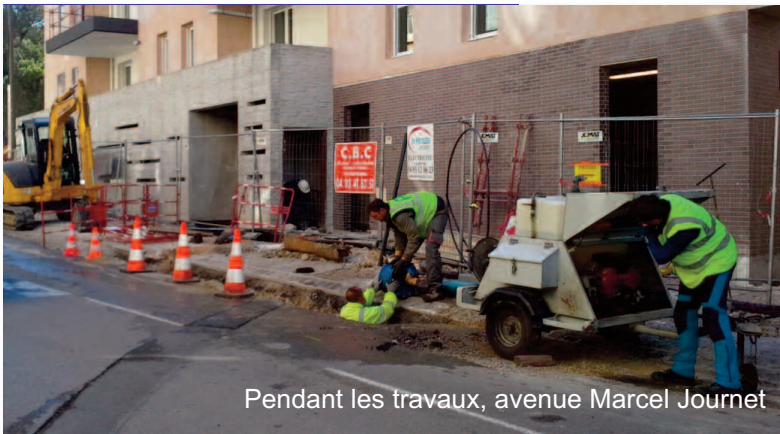
Pendant les travaux, avenue Marcel Journet

Dans le cadre d'une politique de gestion « durable » des réseaux d'eau potable et d'eau usée, la Régie Municipale des Eaux de la commune de Mouans-Sartoux vient de terminer le remplacement de 85 mètres d'une canalisation de 100 mm de diamètre, âgée de 60 ans.