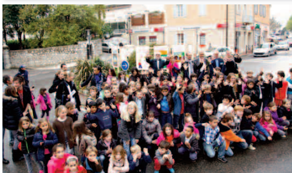
Avec les enfants mouansois lors de la commémoration des Droits de l'enfant avec l'UNICEF.