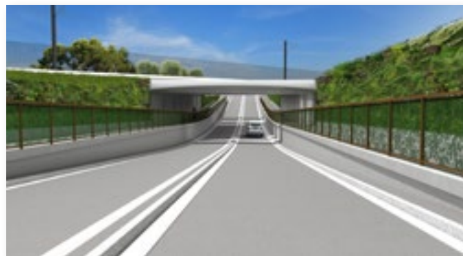
Une esquisse de la Route de Cannes et de la voie ferrée à l'issue des travaux qui dureront un an.

Les travaux sont réalisés par « SNCF réseaux » grâce à des financements du Conseil Régional, de l'Etat, de la SNCF, du Département, de la Communauté d'Agglomération du Pays de Grasse et de la commune de Mougins. La suppression du passage à niveau s'accompagne de travaux