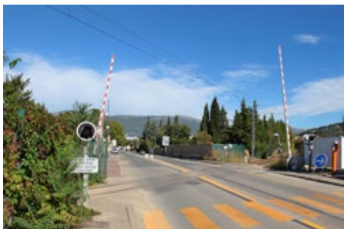
L'actuel passage à niveau, Route de Cannes

A partir du 11 décembre 2017, nous bénéficierons d'un train toute les 1/2 heure. Les Faits Papillon vous tiendra régulièrement informés de l'avancée du chantier.