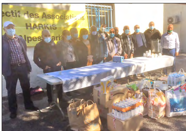
Le collectif des Associations de Harkis des Alpes-Maritimes a également organisé une collecte pour les sinistrés des trois vallées du haut-pays.