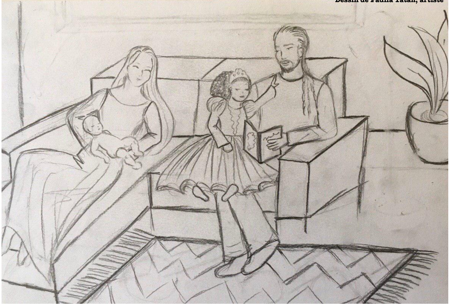
Dessin de Fadila Tatab, artiste